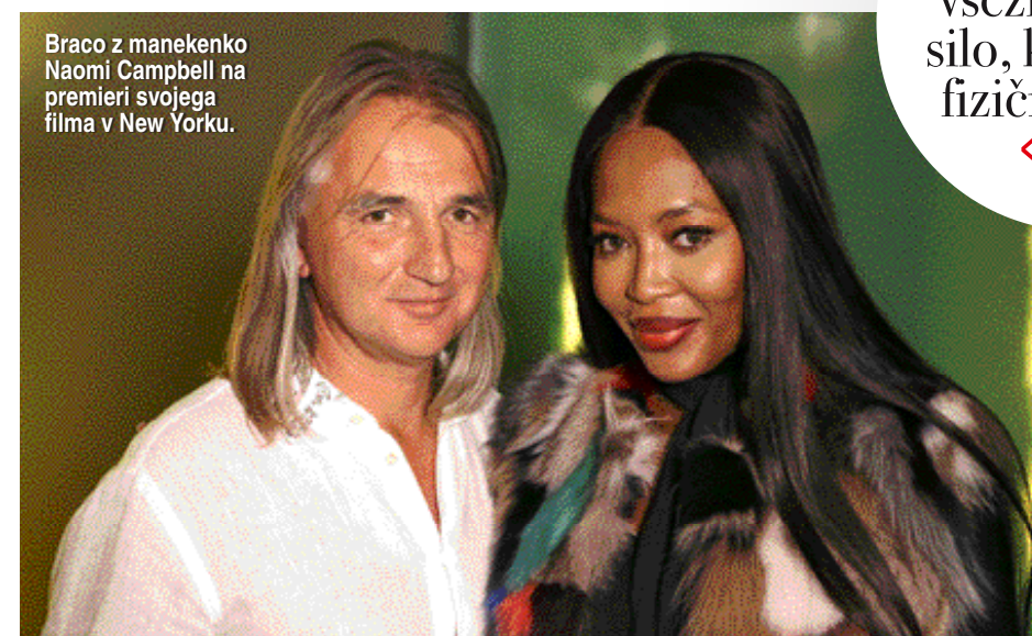
Braco z manekenko Naomi Campbell na premieri svojega filma v New Yorku.